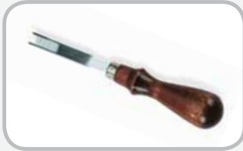
ラフトップ ベルトスカイバー