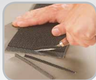
インプレッションカバーをスカイバーで削り取ります。