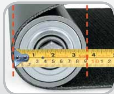
最小プーリー径を測定します。