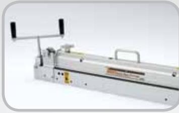
900シリーズ* ベルトカッター