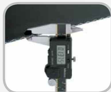
ベルト厚を測定します。