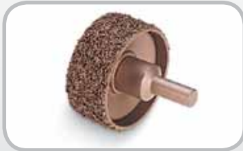
ベルトグラインダー